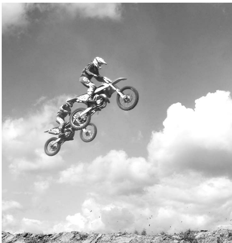
В полете юниоры.