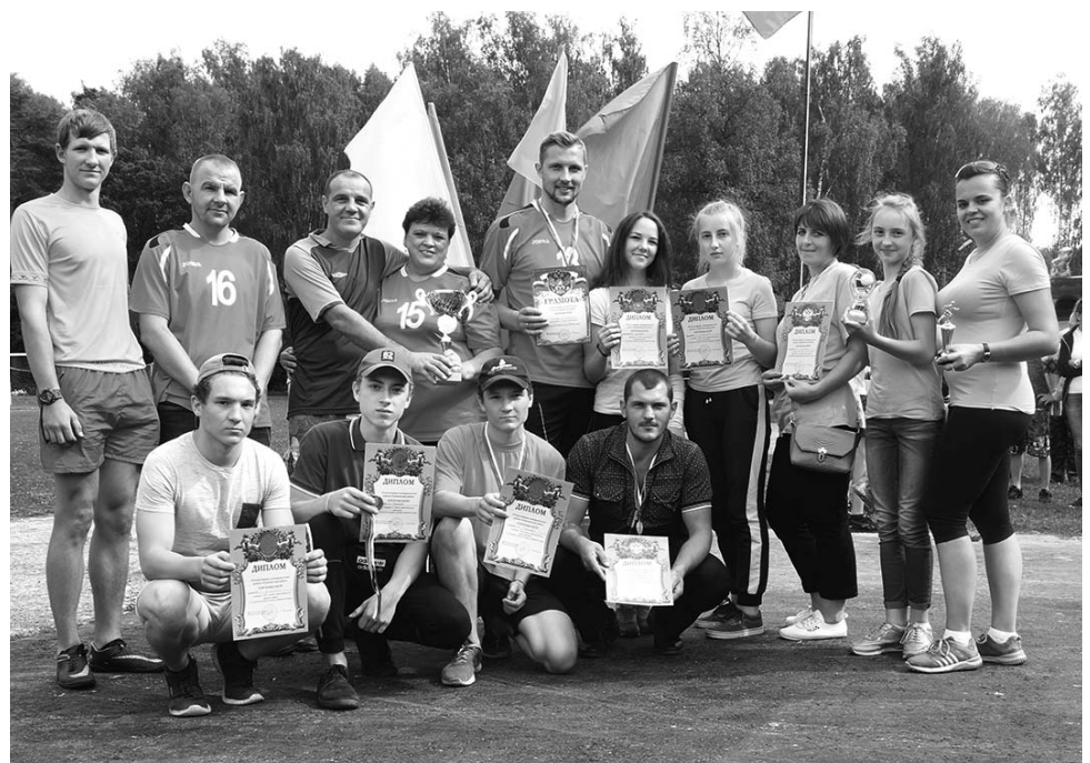
Победители IX сельских спортивных игр - команда СП «Деревня В.Гульцово».