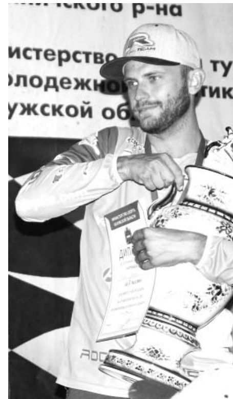
Победитель с главным трофеем.