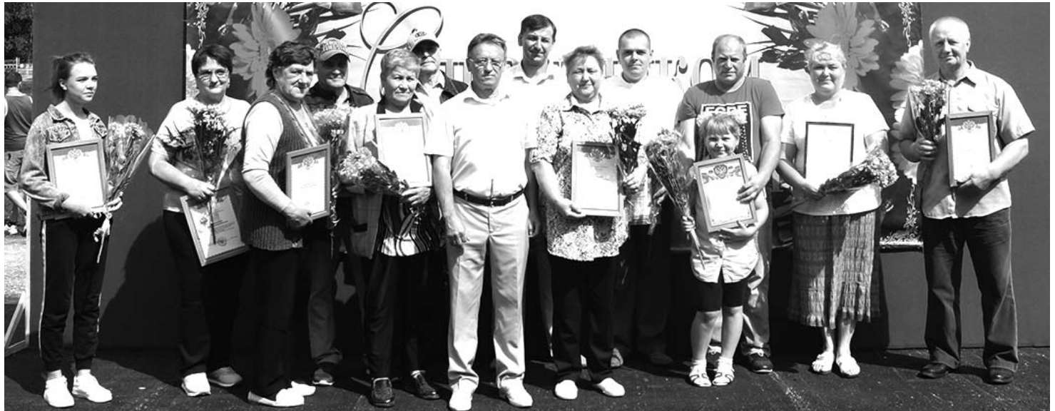
Строителям всех поколений - почет и уважение.

11 августа на «Центральном» был аншлаг – там впервые за последние годы мы вновь всем народом отметили Дни физкультурника и строителя, чествовали ветеранов и тех, кто кует трудовую и спортивную славу своих коллективов и всего района сегодня.